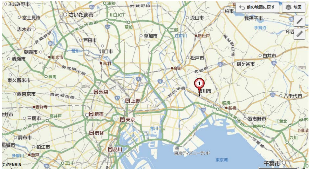
現場研修会の場所