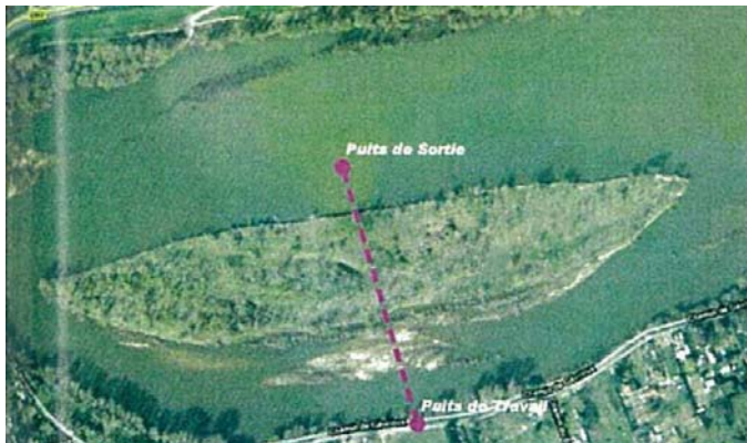
施工場所航空写真

小口径推進は、陸部の作業用立坑から発進してロワール川内の到達立坑まで推進し、トンネル掘削後、到達立坑には処理水を放流するための構造物を建設した。放流設備は、周辺環境への影響を最小限に抑えるよう十分に希釈して流出するための小さな開口部が付けられている。