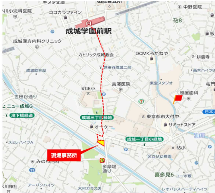
【現場事務所周辺図】